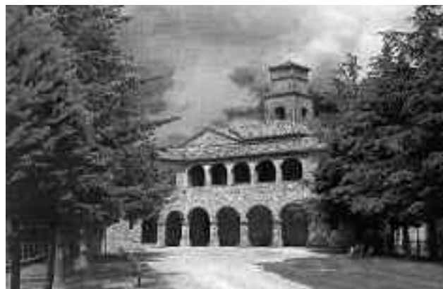
Complesso Monumentale “Montefiorentino”